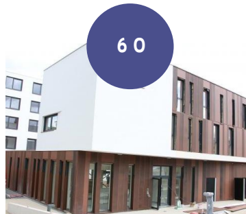
Le Relais Habitat et Services Jeunes - Résidence La Californie - Le Mans